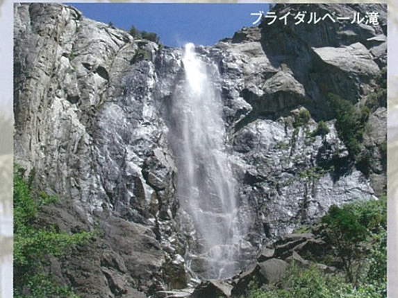
ブライダルベール滝