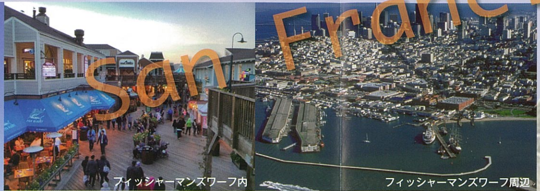
フィッシャーマンズワーフ内

フィッシャーマンズワーフ サンフランシスコの代表的な港 ゴールドラッシュの時代からイタリヤ人漁師の港として栄えたフィッシャーマンズワーフ。サンフランシスコでは欠かせない観光スポット。お土産屋、レストランなど軒を連ね、いつも観光客で賑わう。ピア 41 にある有名な看板。隣にはいつも活気あふれ、観光客で込み合う屋台がある。ここで食べる蟹、クラムチャウダーは絶品。