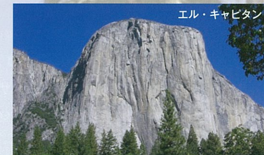
エル・キャピタン

ユネスコの世界遺産にも指定されているヨセミテは氷河に削り取られた荒々しい岩と美しい滝の数々の調和が自然の造形の素晴らしさを実感させてくれます。エル・キャピタン（遠望）やブライダルベール滝を一枚の絵ハガキのように遠望できます。