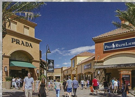
ユニバーサルスタジオ ハリウッド

デザートヒルズ・プレミアム・アウトレット 「ブランドを安く手に入れたい！」とお考えなら、全米でも屈指のセレクションを誇るデザートヒルズ・プレミアム・アウトレットがお勧めです。ロサンゼルスダウンタウンから車にて約1時間半で、砂漠の真ん中にある広大なこのアウトレットモールに到着します。130以上の店舗のなかには、ティオール、グッチ、プラダなど、普段アウトレットモールには見られないトップブランドもあり、西海岸で最も人気のあるアウトレットのひとつとされています。