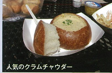
人気のクラムチャウダー

フィッシャーマンズワーフ サンフランシスコの代表的な港 ゴールドラッシュの時代からイタリヤ人漁師の港として栄えたフィッシャーマンズワーフ。サンフランシスコでは欠かせない観光スポット。お土産屋、レストランなど軒を連ね、いつも観光客で賑わう。ピア 41 にある有名な看板。隣にはいつも活気あふれ、観光客で込み合う屋台がある。ここで食べる蟹、クラムチャウダーは絶品。